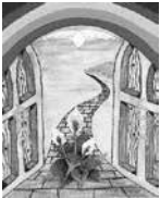
Künstlerin: Angie Fox Weltgebetsstag -Dt. Komitee.e.V.

Weltgebetsstag Freitag, 4. März 2022 aus England, Wales und Nordirland