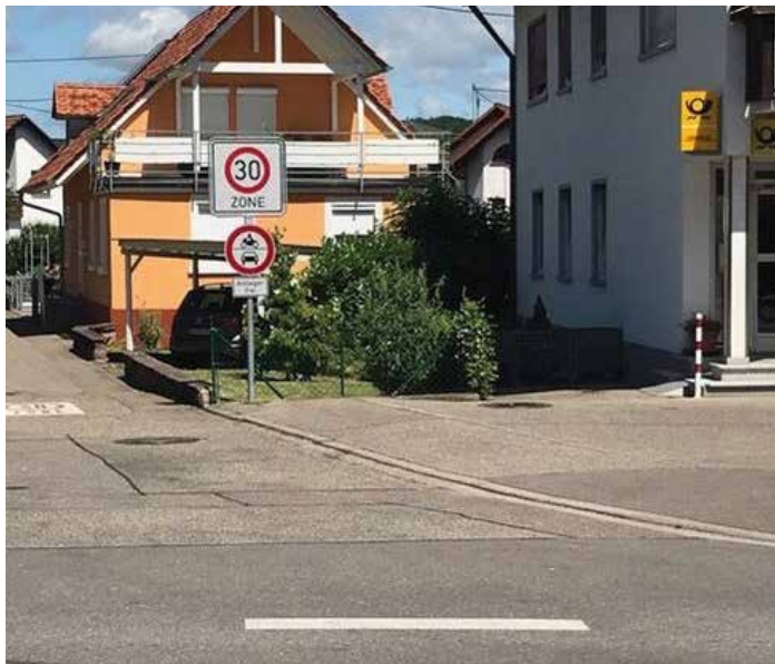
Anlieger frei im Winkel von „der Post“.