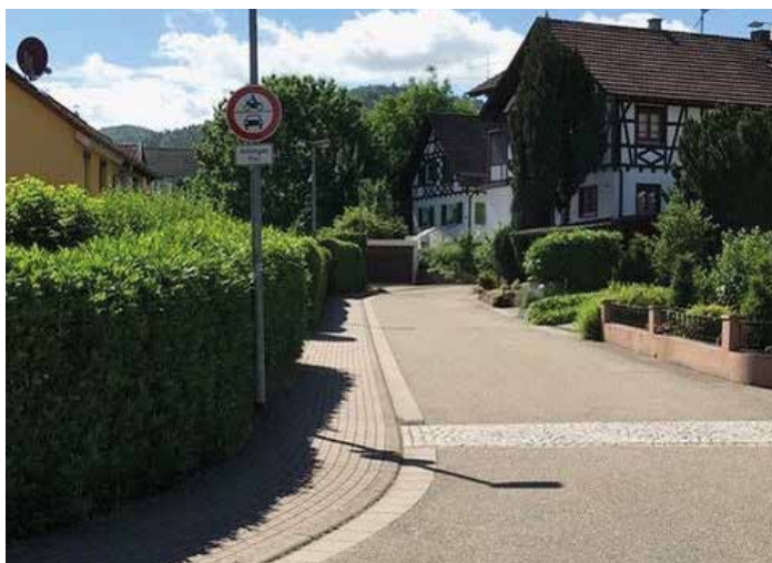
Anlieger frei im Winkel ab Kreuzung Winkel / Lohgässle.