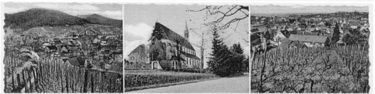
Gruß aus Zell-Weierbach bei Offenburg / Baden

Ein Blick ins Riedletal vom Burschel aus, sowie zur Weingartenkirche vom Pfarrhaus aus und in den Weierbach, zeigt uns die obere Reihe auf der Postkarte. Die zweite Bildreihe zeigt uns ein Blick vom Dorfplatz aus in die heutige Weinstraße und in den Talweg.