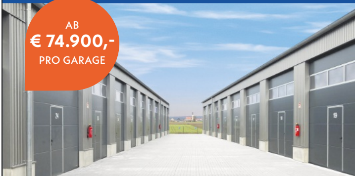
Abbildung: Referenzobjekt XXL-Garagenpark im Interpark Kösching