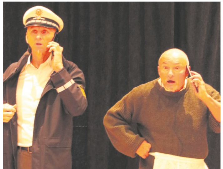
Telefonate, wie sie im echten Leben passieren.

Weitere Informationen unter www.kurzelinks.de/43fc .