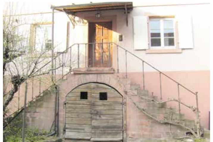
Die Treppe führte zum Eingang der Gastwirtschaft