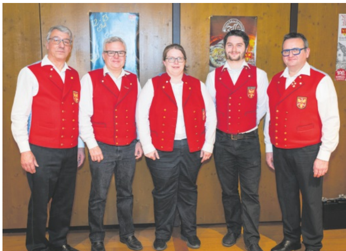
Der aktuelle Vorstand des Musikvereins Zell-Weierbach