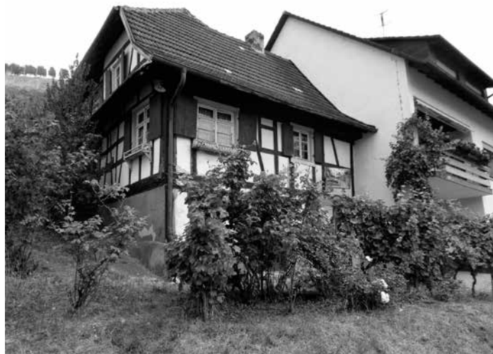
Ein Teil eines ehemaligen Bauernhauses aus dem 18/1900 Jahrhundert steht heute noch im Talweg. Das Haus gehörte dem Rebmann und Landwirt Anton Litterst.

Samstag, 23.11.2019 Schrottsammlung im Ort